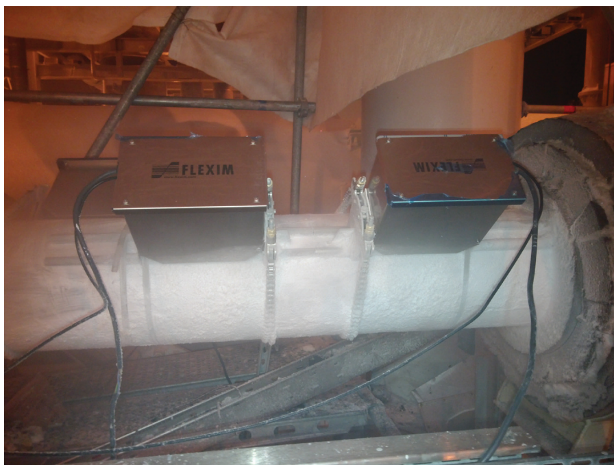
Рис. 2. Расходомер Flexim FLUXUS F800 на трубопроводе с криогенной средой

прилегание. Это позволяет устанавливать расходомер без остановки процесса, что является критическим требованием для многих производств.