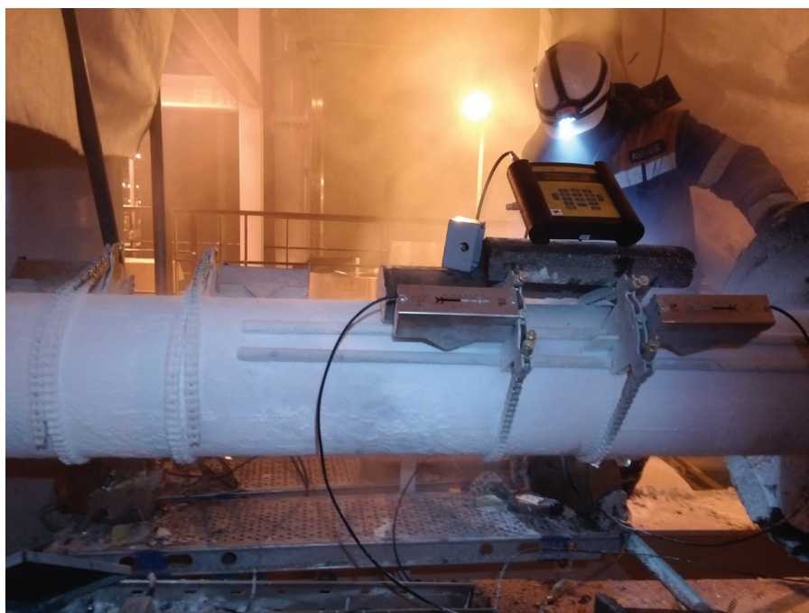
Рис. 3. Монтаж расходомера Flexim FLUXUS F800 на трубе с криогенной жидкой средой

Д. Л. Шумаков: Обычно монтаж приборов на процессах сжиженного природного газа осуществляется до момента запуска производства. Это связано с тем, что перед пуском все трубы уже должны быть изолированы, иначе при снятии изоляции (для установки оборудования) сразу начинается процесс обледенения труб, что мешает монтажу датчиков. Перед нашей компанией стояла задача уста-