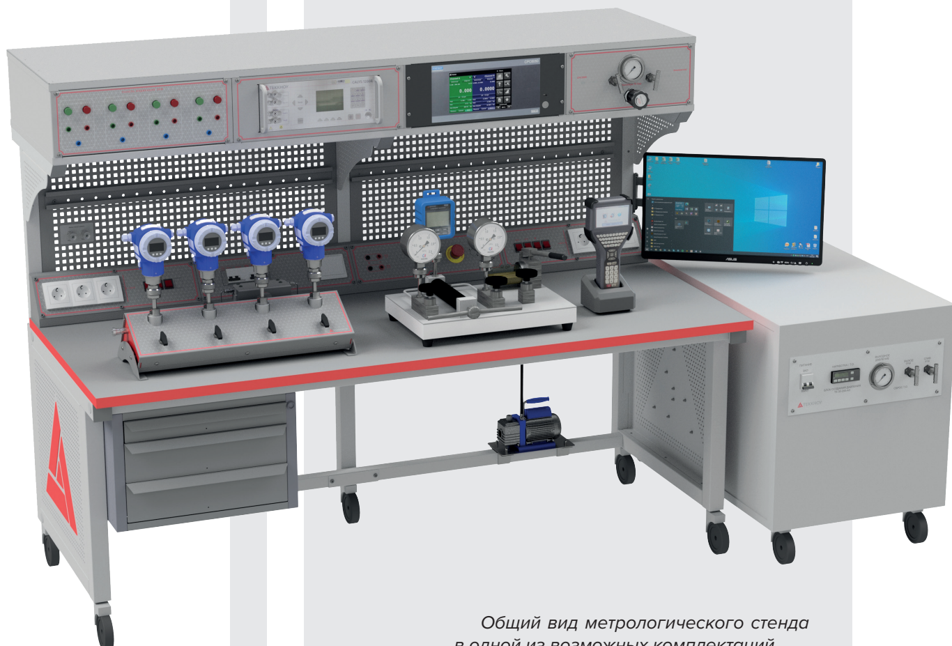
Общий вид метрологического стенда в одной из возможных комплектаций

Метрологические стенды предназначены для поверки, калибровки и ремонта датчиков абсолютного, избыточного и дифференциального давлений, вакуумметров, манометров (в том числе ЭКМ), мановакуумметров, напорометров, тягомеров и тягонапорометров.